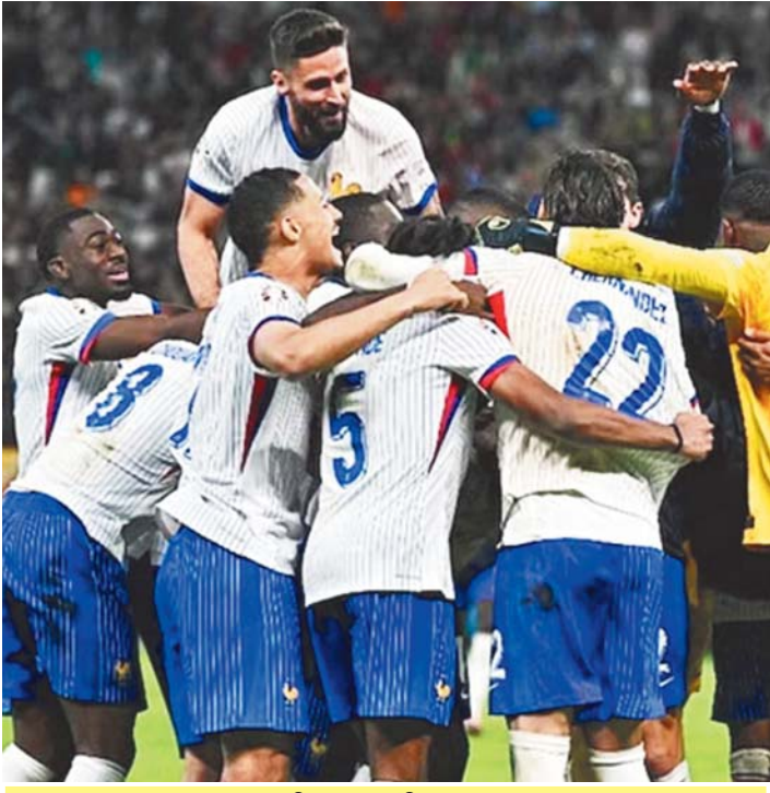
पुर्तगाल वर्सेस फ्रांस: