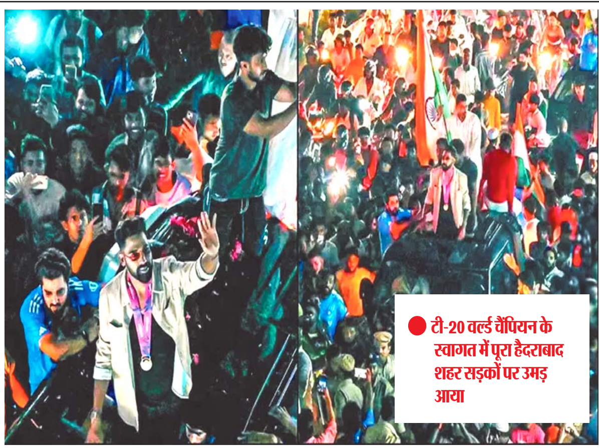
टी-20 वर्ल्ड चैंपियन के स्वागत में पूरा हैदराबाद शहर सड़कों पर उमड़ आया

पुर्तगाल की टीम को पेनल्टी शूटआउट में 5-3 से हरा दिया। इस हार के साथ पुर्तगाल की टीम क्वार्टर फाइनल से बाहर हो गई, जबकि फ्रांस की टीम सेमीफाइनल में पहुंच गई। अब उसका सामना अंतिम-4 में स्पेन से होगा। फुल टाइम और फिर एक्स्ट्रा टाइम तक स्कोर 0-0 की बराबरी पर रूढ़ा था।