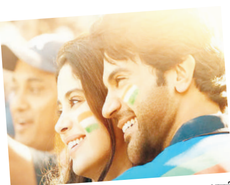
अपनी पत्नी के जरिए जीते हैं। इंटरव्यू में आगे जान्हवी कपूर ने फिल्म के बारे में बताया है। कहानी दो लोगों के बारे में है जो

राजकुमार राव मौजूदा दौर के बेहतरीन अभिनेताओं में से एक हैं। हाल ही में वह फिल्म श्रीकांत में नजर आए थे। फिलहाल वह अपनी आगामी फिल्म मिस्टर एंड मिसेज माही के प्रमोशन में व्यस्त हैं। इस फिल्म में अभिनेता जान्हवी कपूर के साथ स्क्रीन साझा करते नजर आएंगे। अब हाल ही में, एक इंटरव्यू में अभिनेता ने अपनी फिल्म को दर्शकों की कहानी बताया है और पति पत्नी के साथ पर जोर भी दिया है। राजकुमार ने अपने हालिया इंटरव्यू में कहा, यह आप सभी (लोगों) की कहानी है...यह पति-पत्नी की कहानी है...उत्कृष्ट प्यार, झगड़े, अहंकार...उत्कृष्ट करियर...मेरे किरदार का नाम महेंद्र है, वह एक असफल क्रिकेटर है। वह क्रिकेटर बनना चाहता था और देश के लिए खेलना चाहता था, साथियों के दबाव और परिवार के दबाव के कारण वह ऐसा नहीं कर सका। बाद में उसकी शादी हो जाती है और वह अपना सपना