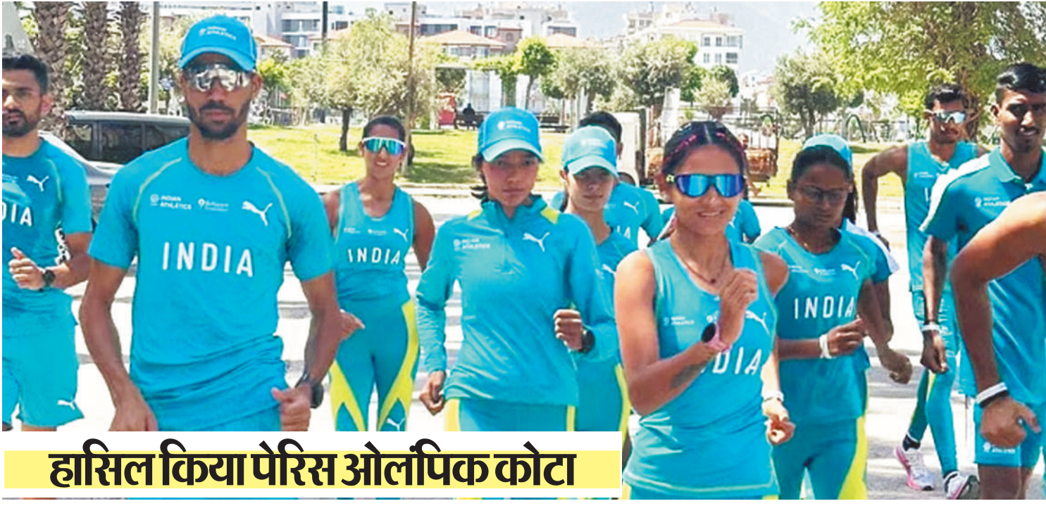
हासिल किया पेरिस ओलंपिक कोटा