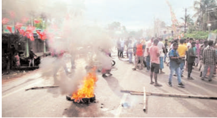
लगाया कि राज्य के सत्तारूढ़ दल के कार्यकर्ता प्रयास करते रहे। यही आरोप तृणमूल कांग्रेस ने भी लोगों को धमकाने और मतदान से रोकने का भाजपा कार्यकर्ताओं पर लगाए। उपद्रवियों की

पश्चिम बंगाल के हर चुनाव में हिंसा की आशंका बनी रहती है। पिछले कुछ वर्षों से जिस तरह भाजपा और तृणमूल कांग्रेस के कार्यकर्ता छोटी-छोटी बातों को लेकर गुल्थमगुल्था होते और हिंसक घटनाएं करते देखे जाते रहे हैं, उसमें इस चुनाव में भी व्यापक हिंसा की आशंका पहले से जताई जा रही है। उसकी शुरुआत कुचबिहार में देखी गई। वहां भाजपा के प्रत्याशी ने आरोप