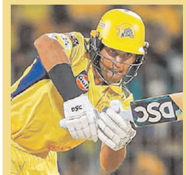
IPL के पहले मैच में ही विवाद

ऑस्ट्रेलियाई दिग्गज स्टीव स्मिथ ने कहा कि सीएसके ने अपने घरेलू फायदे का फायदा उठाया, आरसीबी को बल्लेबाजी लाइनअप को प्रभावी ढंग से दबाव में रखा और पूरे मैच में नियंत्रण बनाए रखा। मुस्ताफिजुर रहमान के शानदार प्रदर्शन के साथ-साथ पूरी सीएसके टीम के योगदान ने येलो आर्मी के लिए व्यापक जीत सुनिश्चित की। मुझे लगता है कि यह शायद चेन्नई के लिए एक आदर्श शुरुआत है।