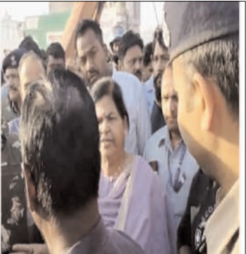
निगम अधिकारियों से कहा- ऐसे आदेश का पालन करोगे तो तुम मरोगे

अगर ऐसा करते है उनको कोन रोकेगा ऐसा है मामला - शनिवार की अल सुबह नगर निगम का भारी-भरकम अमला पुलिस बल के साथ एरोड्रम क्षेत्र के मारवाड़ी अग्रवाल नगर में पहुंचा। निगम के अमले को देखते ही क्षेत्रीय रहवासियों का हुजूम इकट्ठा हो गया। काफी देर तक बहस और नोकझोंक